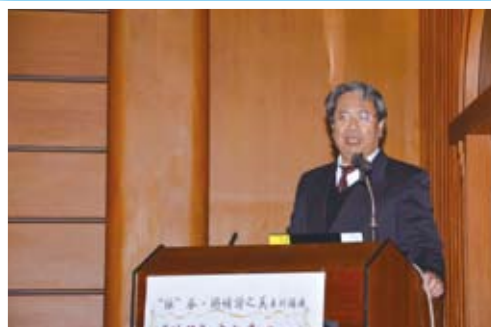
圖1：文幸福教授主講「《詩經》中的春心」。