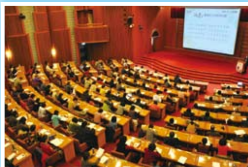
圖2：方瑜教授「春天的歌：唐宋詩之美」演講現場。