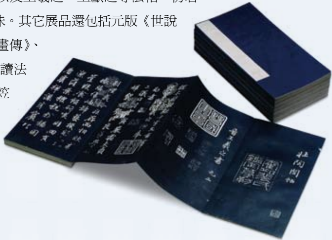
·《壯陶閣帖》拓本。

彩繪，內容呈現現代彩繪寫形傳藝，以圖輔文。又為使海外讀者瞭解中華文化書法極致寫意之美，展覽特別以原尺寸景印重現民國初年收藏家裴景福所製作的巨幅法帖《壯陶閣帖》拓本，內容收錄不少帝王、名臣、諸家，以及王羲之、王獻之等法帖，彷彿歷史人物塗鴉畫冊，饒富藝術與趣味。其它展品還包括元版《世說新語》、《十竹齋書畫譜》、《芥子園畫傳》、《欣賞編》、《織錦回文璇璣圖詩暨諸讀法合刻》、《幽蘭居士東京夢華錄》、《笠翁偶集》、《警世通言》、《老殘遊記》。