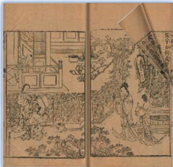
· 本館轉製張琦校刊《吳騷集》電子書。

的邊塞詩人。經歷蒙古征服中土戰爭以後，明代江南文人，即使偶爾縱觀山川形勝，慨然懷抱出塞與大漠游牧民族決戰壯烈成仁之志，更多心神卻是寄託在記述山林園居與藏讀生活結合。他們不僅將閱讀、藏書、著述與旅遊的樂趣結合，擴及到對自然現象的想像與詮釋，以建構知識、性靈生活，還留下不少仿若近代西方百科全書的著作，如（明）王圻編撰《三才圖會》不僅將文字化為圖像，還巨細靡遺彙輯、考證明代以前各式圖像的百科圖鑑，如人物方面，繪畫古今名人形像，宛如目睹，但也有憑空創造，同一時期編印（明）王磐撰《野菜譜》、作者不詳的《天文圖說》，以及偽科學代表性作品《天元玉曆祥異賦》，書中依據古人觀測天地，記錄自然現象變化，再根據這些現象，推演人間現實生活的意義；世稱「三百年來江南第一才女」的明人文倣，她所繪製的《金石昆蟲草木狀》，全書計繪本草圖1,070種，不僅具有欣賞價值，也是研究藥材罕見的圖鑑資料。另外，本次展覽也陳列《西湖志類鈔》與《裨海記遊》兩本描述自然景觀的代表性書籍，讀者不妨對照了解傳統文人處理大陸文化核心與邊疆的差異性論述及想像之不同處。