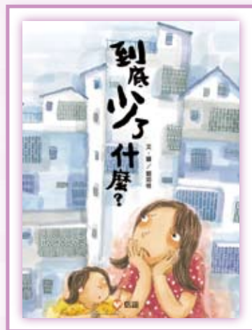
· 《到底少了什麼？》。

《到底少了什麼？》是一個以「花」為主的故事。一翻開書，我們看到大都會中公寓櫛次鱗比，每一戶人家都被冰冷剛硬的鐵窗緊錮住，彷彿人們設下鐵窗，把自己關在水泥隔牆裡。但後來小女孩的媽媽神來一筆，用美麗的花朵溫暖了人心，冷冰冰的鐵窗從此有了綠意，整個社區變得美麗而豐實。有了愛，有了希望，生活中再也不缺什麼了。這個故事是現代生活啓示錄，它提醒我們在忙碌的生活中，偶爾也該停下腳步，欣賞一下身邊的花花草草，它們可都是大自然賜給我們最珍貴的生命資糧啊。