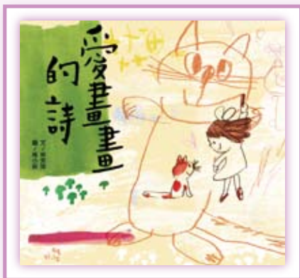
· 《愛畫畫的詩》。

如果，雲會寫詩？如果，詩會畫畫？如果，畫會說話？這是作者林芳萍有天在看雲的時候，想到的三個「如果」的願望，於是她讓想像力奔馳，讓詩自己畫畫兒。這些會畫畫的詩叫作「圖像詩」，利用每行詩句所使用的字數和排列，讓整首詩有了具像的形狀，而這首詩的形狀又正好能呼應該首詩的主題，呈現出「詩中有畫」的效果，為閱讀者帶來更多視覺的喜悅。