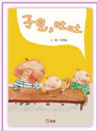
· 《子兒，吐吐》（圖片提供 / 信誼基金出版社）。