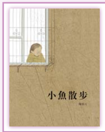
· 《小魚散步》。

小魚出門買雞蛋，簡單的散步過程變成了一個想像的冒險之旅。《小魚散步》以散文詩情的方式，敘述生活的小插曲，故事很基本，但簡單的字、句，輕易表達了小魚在轉化小事情的歡愉。它以摩登的技法呈現出臺灣地方面貌，既國際又不失地域辨別性，曾獲得美國重量級刊物《出版人周刊》選為當年度最佳童書，《出版人周刊》稱讚它：「在購物商場充斥的年代，臺灣女孩小魚帶我們來一趟簡單的雜貨店購物之旅，一同拾回童年的純真歡欣。」《小魚散步》是第一本讓世界看到「臺灣」的作品。