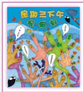
· 《星期三下午捉蝌蚪》(圖片提供 / 信誼基金出版社)。

在星期三下午，一群愛玩耍的小朋友、忙裡偷閒的老師，熱熱鬧鬧的演出了一齣捉蝌蚪的戲碼。《星期三下午捉蝌蚪》不拘泥於傳統的說故事手法，對話多線發展，文圖交融，渾然成一體，不只敘述了一個有趣的師生活動，更展示出自由度極大的圖畫書繪寫的創作空間。同時，它超越時空限制，以蒙太奇拼貼表現的技法及背離現實的大膽想像，創造出融合動感、喜感和後現代感的嶄新風格，成為前衛的圖畫書新品種。