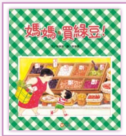
· 《媽媽，買綠豆！》（圖片提供 / 信誼基金出版社）。

阿寶喜歡和媽媽去買菜，每一次他都說：「媽媽，買綠豆！」……，《媽媽，買綠豆！》描繪出的文化風景——貨物琳琅滿目的柑仔店、在夏天的午後喝一碗甜甜的綠豆湯、吃一根透心涼的綠豆冰棒是很多臺灣人兒時的生活記憶，全書洋溢著臺灣平凡家庭中親密的母子情懷，讓親子共讀時，品嚐到幸福而滿足的滋味。出版至今二十餘年，仍高踞暢銷排行榜上，它兼具臺灣地域色彩和孩子普遍經驗，透過一代又一代大小讀者的閱讀和傳誦，已成為臺灣圖畫書的新經典。