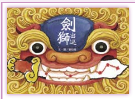
· 《劍獅出巡》。

午後炙熱的太陽，照著臨海小鎮昏昏欲睡，連守護宅院的紅臉劍獅，也忍不住打起盹來……，《劍獅出巡》中呈現臺灣小鎮熱天時百無聊賴的這番景象，實在是我們都太熟悉的童年時光了。作者以臺南安平的劍獅為主角，巧妙將傳統藝術與民間信仰融入故事，人物造型樸拙，搭配鄉土氣息濃厚的場景，整本書文化痕跡俯拾皆是，充滿了溫暖的歷史情意。《劍獅出巡》深具人文色彩又兼具童趣，作者善於從周遭的生活文化中擷取有趣的事物和元素，讓孩子對自己的文化產生興趣和認同，成功的為鄉土圖畫書開拓了新的創作方向。