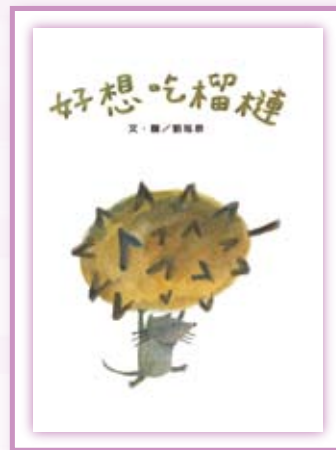
· 《好想吃榴槤》。

《好想吃榴槤》以單純的心理渴望出發，帶來了一連串的行動，相當貼近幼兒的探索世界。本書圖畫的筆法看似隨意塗鴉，但在幾個關鍵地方，匠心獨運的把手寫文字「好想好吃榴槤」鑲入圖畫中，把動物們好想吃榴槤的「渴望」繪聲繪影的表達出來，讓讀者彷彿也聽到了小老鼠和動物們心中大聲的吶喊。非美術科班出身的作者寓拙於巧，直接而大膽的表現手法，是本書最大的魅力。