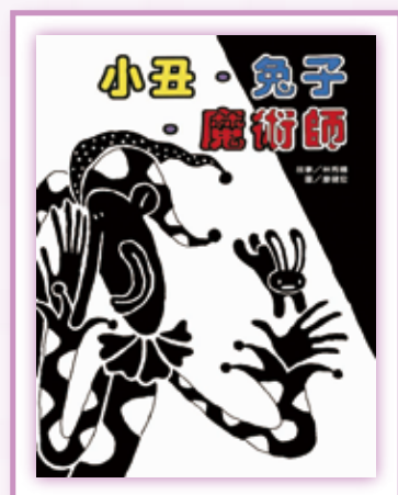
· 《小丑、兔子、魔術師》。

小兔子和小丑在舞臺上大玩你來追我來藏的遊戲，賣力的演出了一場精彩好戲。《小丑、兔子、魔術師》是本無字書，僅以黑白對比的兩色作畫，巧妙的活用「光」與「影」，營造出類似剪影畫的美妙效果；而在看似單調的黑白對比圖畫中，大量利用圓點與線條的多樣變化，呈現了極為豐富的裝飾之美。《小丑、兔子、魔術師》充滿動感，書中埋藏的諸多細節，讓孩子反覆閱讀，每次都有發現的驚喜，是一本童趣十足的創意圖畫書。