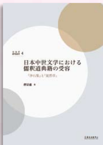
· 《日本中世文學における儒積道典籍の受容：『砂石集』と『徒然草』》。