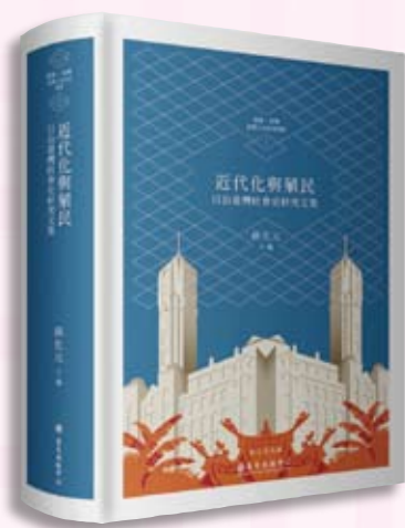
· 《近代化與殖民：日治臺灣社會史研究文集》。