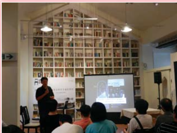
· 「小藝埕」三樓「思劇場」經常不定期舉辦公開(免費)演講活動，後方即是挑高五米半的招牌書牆。

至於三樓「思劇場」主要提供商業及藝文公益活動租借，裡頭設有一面挑高五米半、從地面延伸相連至斜屋頂天花板上的壯觀書牆巍峨矗立，堪稱「小藝埕」全店最令人動容的一道招牌 Landmark (空間地標)。