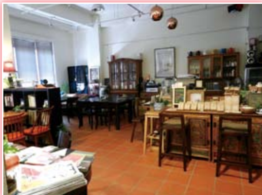
· 咖啡館內既復古又前衛的空間設計。

沿著牆邊樓梯走上二樓則是精品「爐鍋咖啡」(lugu cafe)，這裡不乏經營者早期從網路郵購或二手市場依著不同的機緣經年累月蒐集得來的舊家具(包括老式長條板凳和打字機)、線條造型兼具摩登與古典風味的桌椅，加上挑高天花板搭配紅色方塊地磚，另有視覺穿透的矮櫃陳設之間且隨處擺放著店主人的私房藏書以及各類時事藝文雜誌，營造出既復古又前衛的新鮮感，在幽微溫潤的光影下，彷彿於濃郁的咖啡味道中透著一股書香的獨特氛圍總是令店內生意經常高朋滿座。