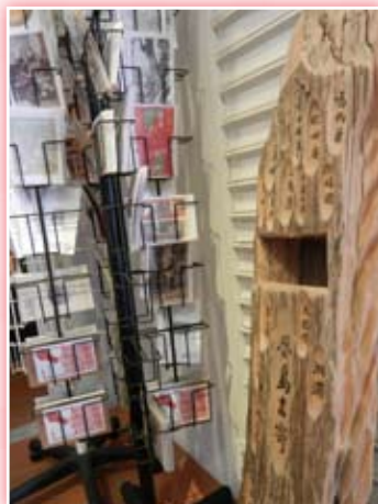
· 書店一角擺放著「小草明信片」以及檜木手工精製的「夢島書寄」信筒。