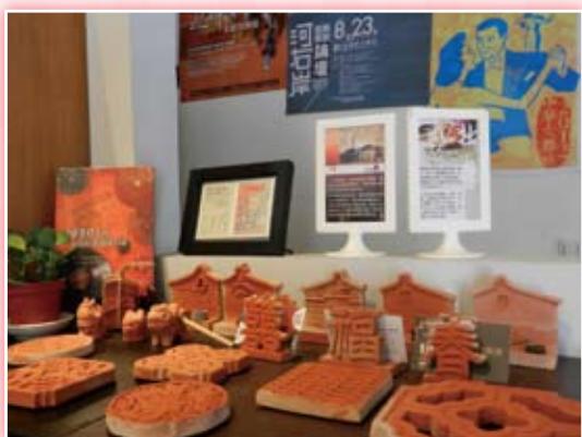
·「小藝埕 -1920 書店」室內風景。