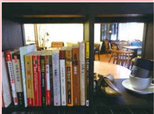
· 二樓「爐鍋咖啡」每每不乏有濃郁的咖啡味道伴隨著書香氣息。