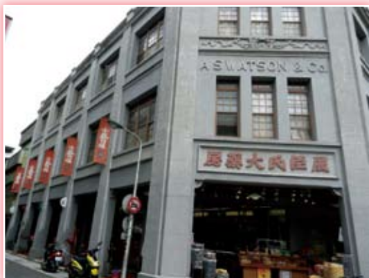
· 位在「屈臣氏大藥房」百年街屋的「小藝埕」(ArtYard) 今後盼能吸引不同客群來到迪化街。