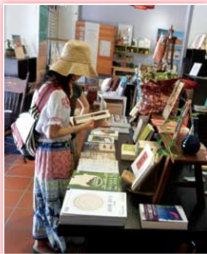
·「小藝埕 -1920 書店」閱讀一景。

來到「小藝埕」，開門見山走進這幢老房子街屋一樓便是人文書店「Bookstore 1920s」以及布料設計工作室「印花樂」，此處店面空間不大、卻也自有一番從容愜意的悠然景緻，入口平臺陳列著每月份主題重點書如「小草藝術學院」圖文集《寫給島嶼的情詩》、蘇碩斌的《看不見與看得見的臺北》、謝里法的《紫色大稻埕》等，書架上包含了臺灣文學、美術設計、旅遊踏查、社會思潮以及臺北城市史等相關題材選書，此外在這兒也能找到些二、三〇年代絕版臺灣流行歌復刻唱片專輯，一旁角落還有「小草明信片」以及檜木手工精製的「夢島書寄」信筒倚門而立，整個書店空間可謂具體而微地鮮明標誌出大稻埕從過去到現在的百年文化風景。