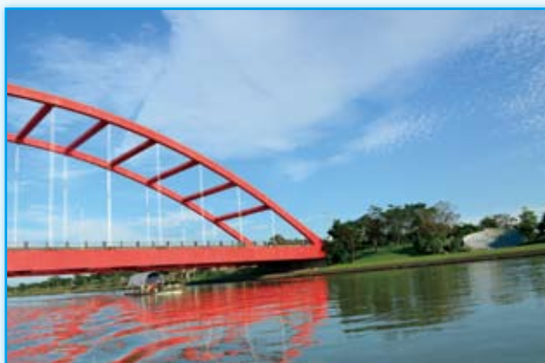
· 陽光照射下，利澤簡橋的紅暈映照在冬山河水面，壯觀而美麗。

紅色的布疋 將冬山河溫暖地裹住 連天上的雲也跟著 羞紅了臉 河岸單車道上 一排臺灣白蠟樹綽約地 在風中舞動 一隻蒼鷺在河濱 查問利澤簡社的舊籍 當年馬偕落腳之地 教堂鐘聲依稀 這寬闊的河 穿過夕照下的鐵橋 鐵橋上一列北迴線火車 也正穿過黃昏 穿過漾盪噶瑪蘭氛圍的金黃水色