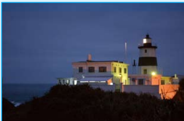
· 入夜後放出第一道光芒的富貴角燈塔

詩可以是這種人文風貌的結晶體。通過詩，可以記錄臺灣的風景，寫出臺灣的人文和城鄉變遷。