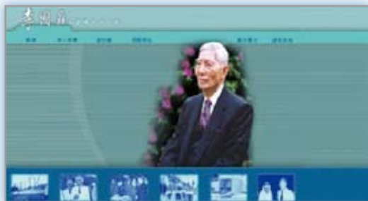
· 李國鼎先生多媒體資料庫 ( http://ktli.sinica.edu.tw/ )

李國鼎先生對圖書館有一份深厚的感情，他對於中央圖書館的愛護，緣出於體認到社會的進步並非靠財富，而端賴於知識的掌握和共同的努力。