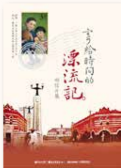
· 「寄給時間的漂流記」主題海報

由於明信片圖像主題多樣，如風景名勝、人物寫真、城鄉建築、重大災害、歷史事件紀念、動植物、藝術作品、風俗民情，展現近代社會庶民生活，具有高度價值。這些材料可以幫助我們瞭解過去，透過體驗時光之旅。因此，國家圖書館對於明信片的典藏甚為重視，現有館藏包括臺灣明信片 4,800 張，大陸明信片 8,800 張。其中臺灣之部分已刊載於「臺灣記憶」主題網站（ http://memory.ncl.edu.tw ），吸引不少讀者，深入研究。