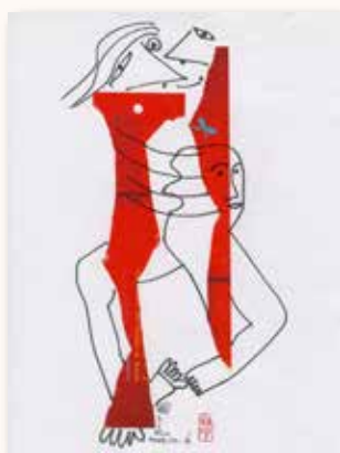
· 林煥彰撕貼畫〈相擁〉 (圖片提供／國家圖書館)