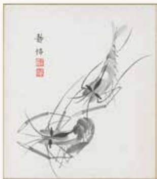
· 涂靜怡水墨小品〈蝦子〉