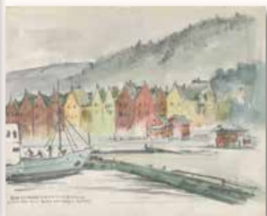
· 梁丹丰水彩〈挪威海岸〉