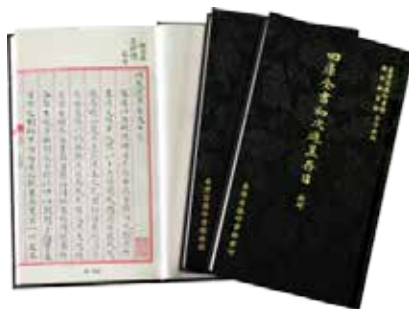
· 國家圖書館授權與臺灣商務合作出版《四庫全書初次進呈存目》。