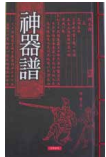
· 國家圖書館授權世界書局出版的《神器譜》。

2012 年 10 月授權大塊公司與本館合作出版的另一部國寶級古籍宋嘉定六年（1213）焦尾本《註東坡先生詩》的出版。