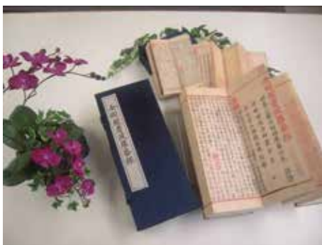
· 國家圖書館原貌限量複製出版《金剛般若波羅蜜經》。

2012 年更是本館善本古籍合作重印出版重要的一年，本館依據「國家圖書館特藏古籍文獻複製品借印出版管理要點」分別與世界書局、大塊文化出版股份有限公司、臺灣商務印書館、新文豐出版公司等分別簽訂合作或授權出版協議。