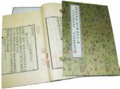
· 國家圖書館授權世界書局出版的明版汲古閣精鈔本《梅屋詩餘》。

2012 年 4 月，授權世界書局出版的明版汲古閣精鈔本《梅屋詩餘》、9 月出版《神器譜》及 12 月出版《太古遺音》。