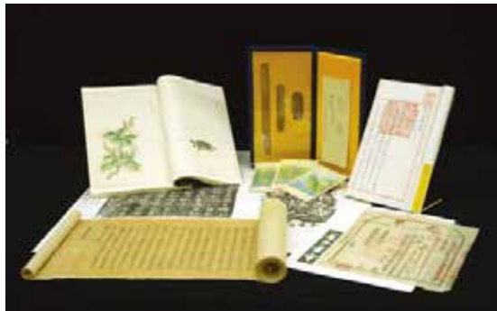
· 國家圖書館珍藏之特藏文獻。