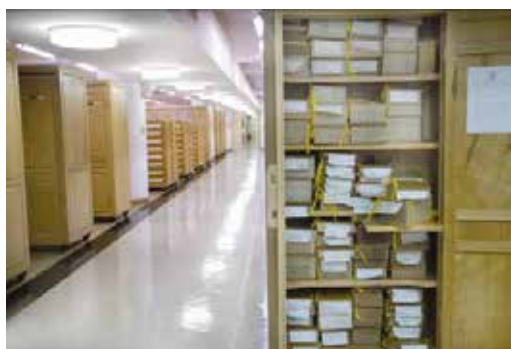
· 國家圖書館善本書庫。

近年來，隨著臺灣意識的普及、數位科技的發展以及政府的鼓勵，古籍相關的文獻資源進入了快速數位化的時代，這樣的變化不止為古籍文獻的研究營造了舒適的環境，也對古籍文獻的研究帶來了一定程度的實質影響。