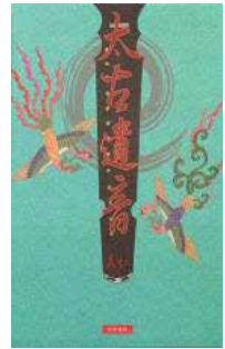
· 國家圖書館授權世界書局合作出版的《太古遺音》。