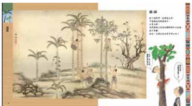
· 國家圖書館與小魯公司合作出版童書《臺灣平埔族生活圖誌》。