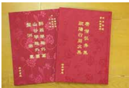
· 國家圖書館與世界書局合作出版《希古堂珍藏秘籍》。

2013年4月與世界書局合作出版《希古堂珍藏秘籍》，內容包括有宋李羣編《唐僧弘秀集》、唐歐陽詹撰《歐陽行周文集》、宋歐陽修撰《醉翁琴趣外篇》、宋黃庭堅撰《山谷琴趣外編》、宋洪适撰《盤洲樂章》等五部珍貴古籍；2013年5月出版《金石昆蟲草本狀》。