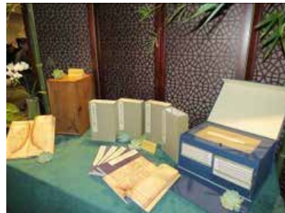
· 國家圖書館授權大塊公司合作出版《註東坡先生詩》。