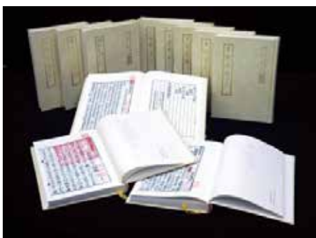
· 國立中央圖書館善本叢刊。

版多元地呈現於網路，並結合行動載具，供讀者於手機、iPad 及個人電腦瀏覽翻閱，大大增進了古籍閱讀的便利性及流通性。