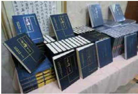
· 國家圖書館與臺灣商務印書館合作出版《子海珍本編·臺灣卷》。

本館以加值應用數位化成果，將古籍活出現代風貌，重現經典之美，本館將積極與國內主要古籍典藏單位及出版界建立合作機制，共同為此極具意義且有價值的文化傳承而努力，並為古籍重印或複刻出版將有一番新氣象、新發展。