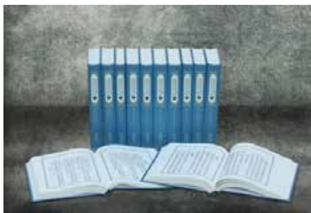
· 國家圖書館與新文豐出版公司合作出版《臺灣珍藏善本叢刊》。

2013年7月與新文豐出版公司合作出版《臺灣珍藏善本叢刊·古鈔本明代詩文集》第一輯。這次複製本《古鈔本明代詩文集》內容包括十七部古鈔本，有（明）許繼撰《觀樂生詩集》、（明）平顯撰《松雨軒集》、（明）謝貞撰《鶴鳴集》、（明）吳訥撰《思菴先生文粹》、（明）張徹撰《退軒集》、（明）祝顥撰《侗軒集》、（明）王磐撰《王西樓先生詩集》、（明）趙統撰《趙驪山先生類稿》、（明）鄭元樂撰《五嶺山人文集》、（明）龔用卿撰《雲岡公文集》、（明）馮大受撰《馮咸甫詩集》、（明）羅萬藻撰《小千園全集》、（明）浦義升撰《赤霞公詩鈔》、（明）葛如麟撰《葛如麟文集》、（明）包禎撰《包飲和詩集》、（明）張于度撰《張逸民南遊草》、（明）顧湄撰《違竿集》等。