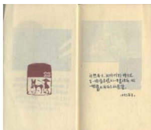
·《結婚式》／索章三著；出版／民間美術，1994年。

「我想有一天，我將找到一種方式，在一個像這樣的一本書裡面，做一個屬於我自己的展覽」。翻覽書頁的圖章上，印有一隻小毛驢，那是當年呂秀蘭在四川山區遇到的，隨之便將牠買下來用來搬運紙張並作為交通工具，後來也成了象徵「紙路」的精神圖騰。