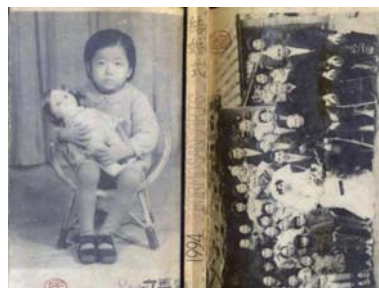
· 《結婚式》／索章三著；出版／民間美術，1994年。

此書記錄了四個臺灣本土家族的影像敘事，加以剪裁古早結婚典禮的老照片，象徵著從個體生命乃至族群歷史的繁衍與再生，且不禁令人緬懷離家以後的濃濃鄉愁。