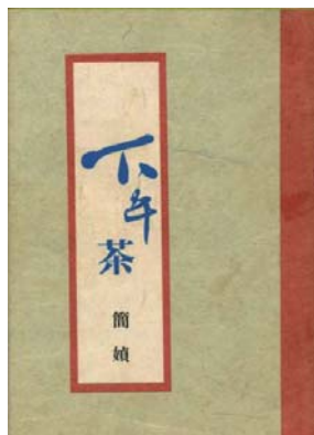
·《下午茶》／簡媜著；出版／大雁書店，1989年；封面設計／呂秀蘭。