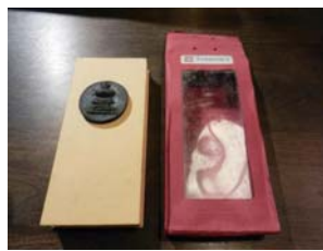
·「民間美術」日出黑陶經摺筆記。