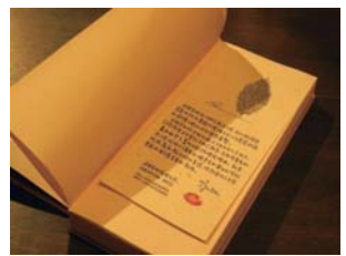
·「民間美術」日出黑陶經摺筆記。