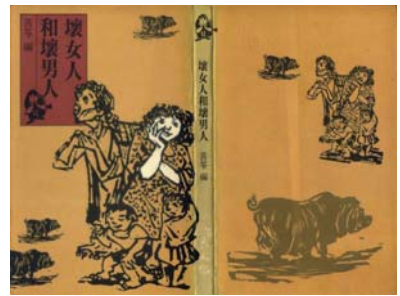
·《壞女人和壞男人》／苦苓編；出版／派色文化，1990年；封面設計／呂秀蘭。