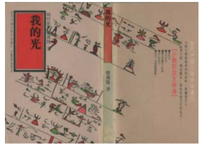
·《我的光》／鄭萬隆著；出版／新地出版社，1987年；封面設計／呂秀蘭。