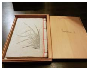
·「民間美術」木盒精裝綿紙筆記。