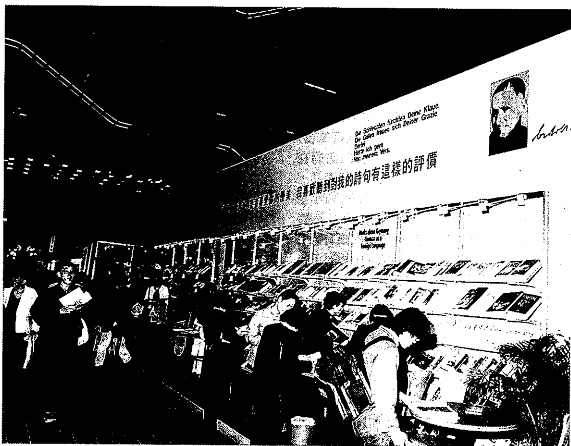
•臺北國際書展是定位於「銷售」和「版權交易」兩大功能之國際性書展

Rightscenter.com的技術系統是從兩年多前開始研發的。公司創始人及執行總裁派仁特(Parent)先生應紐約大名鼎鼎的文學經紀人布洛克曼公司的邀請參加了前年法蘭克福書展，隨後受布洛克曼的委託開始建立該體系。經過近兩年的試用改進，系統進入成熟階段。在1999年10月法蘭克福書展，Rightscenter.com作為一家網路專業公司正式成立，由風險投資商及書業界共同投資。當時只有六位成員。到今年一月初，該公司已有全職、半職雇員18人，其中半職的多為專業顧問。其計畫是在一年內達到40人左右的規模。目前有四分之一的雇員分布在紐約、倫敦及其他地區。