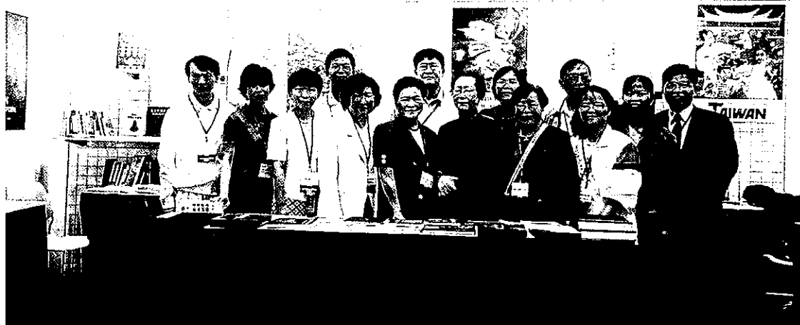
• 第一一八屆美國圖書館學會年會書展（民國88年6月25日至30日）假美國紐奧良市舉行，除圖書出版商外，還吸引資訊系統業、書刊代理商、各類型圖書館和圖書館專業團體參展

訊網的快速普及，網路資源急遽成長的趨勢，AAS也在網路上設立網站 http://www.aasianst.org ，提供會員上線查詢。