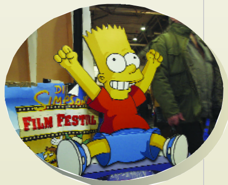
「辛普森家族」也是漫畫展場內的要角之一。

另外外交部還也成立了特別工作委員會，統籌工作的進行。其中第一階段：以重建巴格達大學的德文圖書館為要務；由於去年英美聯軍進軍伊拉克，其間有超過一萬五千多種的館藏圖書毀損；也因此歌德學院著手整理相關的書目，藉以能籌募一般德文研究所必備的工具書；另外也希望能協助修復受戰火波及的圖書館，以期能正常運作。德國的外長費雪更盼望：德國書商交易協會和出版協會的成員們，都能共同響應這一項送書的呼籲；到了明年的春季，希望能送交一萬冊相關的書籍到巴格達為先期目標。