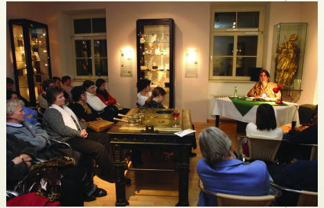
各種相關的朗讀會，在書展開幕後，陸續上場。