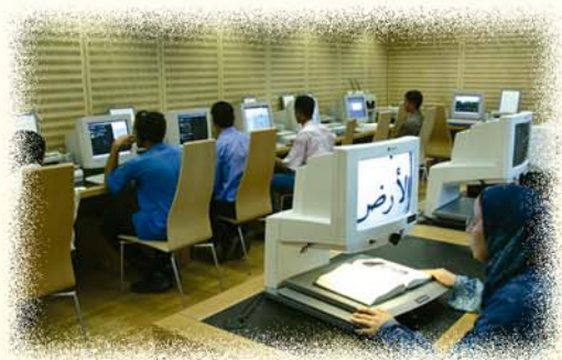
▲ 他巴·胡賽因圖書館是專為視障的人們，提供點字書和有聲書的閱覽服務