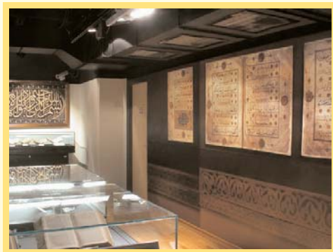
▲ 圖書館內絕版古書的主題展示

以「引起閱讀的興趣」為主要的訴求，而在閱覽區內，還特別規劃了：1. 圖畫書區：以阿