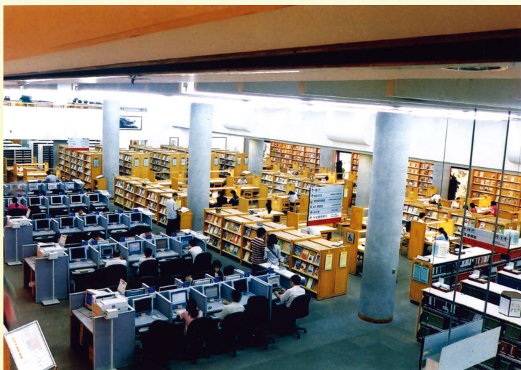
· 鳥瞰國家圖書館3樓期刊閱覽室，現刊雜誌林林總總陳列架上，任君挑選。